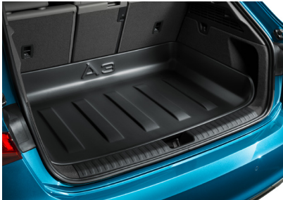
بطانة تحميل صلبة