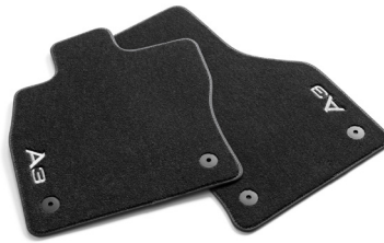
طبقة واقية لعتبة التّحميل