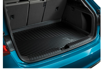
سجاد مميّز للأرضية