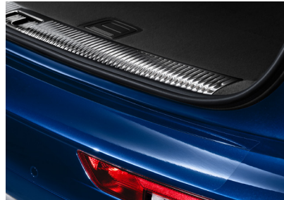
طبقة واقية لعتبة التّحميل