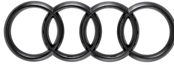
شارات وحلقات سوداء