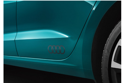
بطانة صندوق الأمتعة